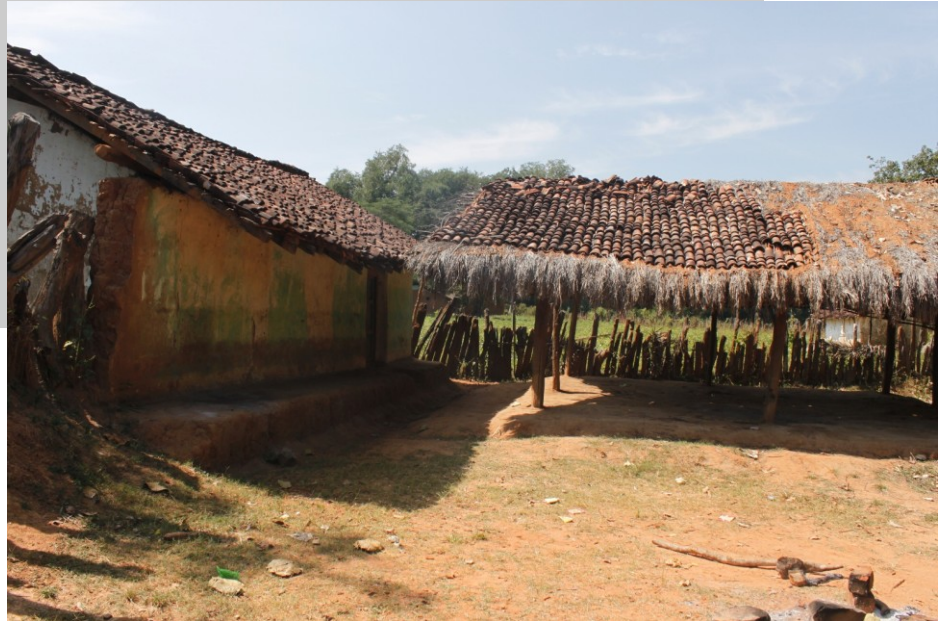
बलेंगापारा में त्यागा हुआ घोटल

बाहरी दबाव के कारण बलेंगापारा के घोटल को बंद करना पड़ा. घोटल बंद होने के बाद शिक्षा और समुचित कुशलताएँ सीखने की एक महत्वपूर्ण संस्था का अंत हो गया. उसके कारण युवा गाँव छोड़ कर जाने लगे, क्योंकि उन्हें मिलने वाला सामाजिक समर्थन अब लगभग खत्म हो चला था.